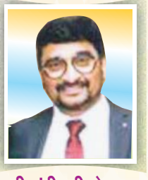
श्री संदीपजी वोडल शाखा-औरंगाबाद