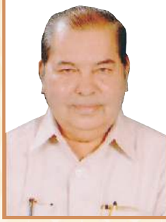
श्री नरेंद्रजी मोदी (संचालक)